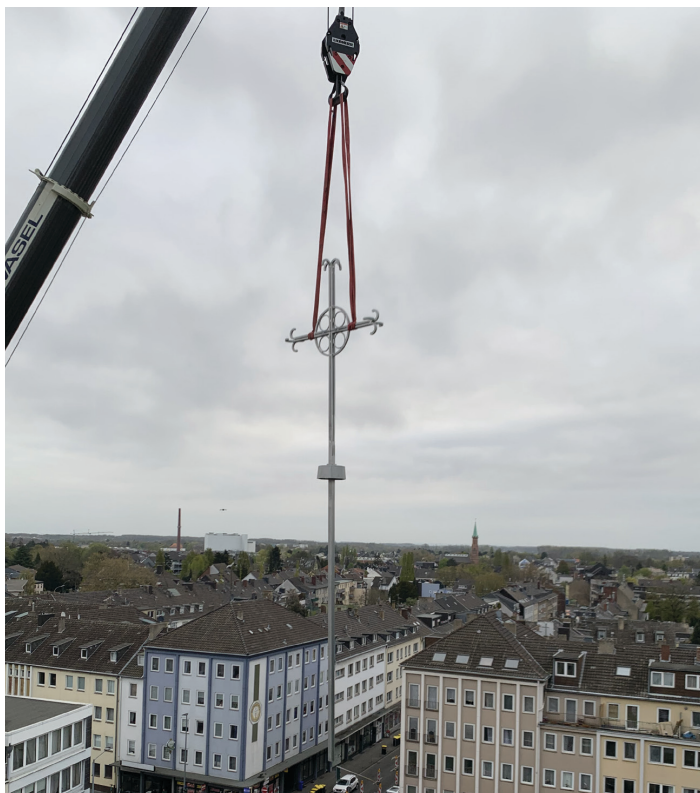
Das neue Turmkreuz der Rheydter Hauptkirche

Bitte beachten Sie, dass alle genannten Veranstaltungen unvorhersehbaren Änderungen unterliegen können!