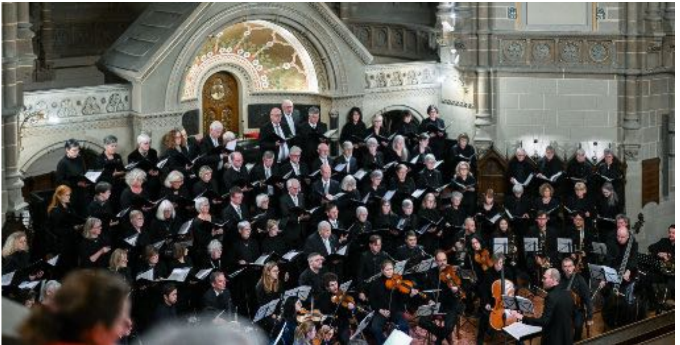
Die Kantorei der Hauptkirche

Restkarten an der Abendkasse ab 17.15 Uhr.